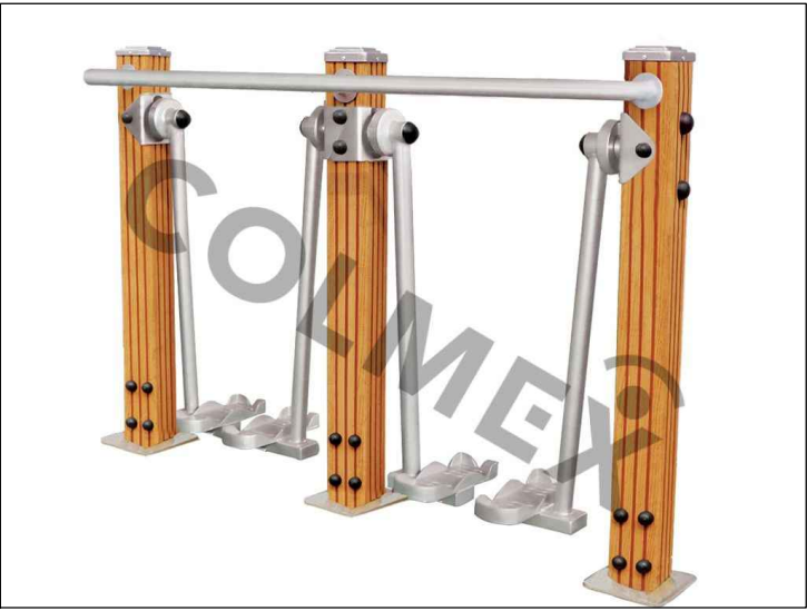
a CHŮZE 2010x480x1285