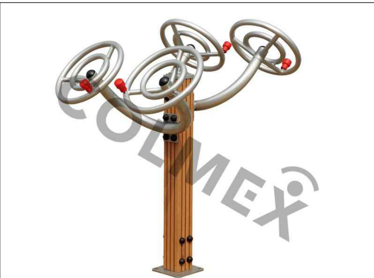
b KLOUBY 1115x1020x1400