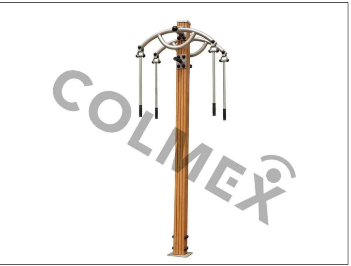
c RAMENA, ZÁDA 920x570x2375