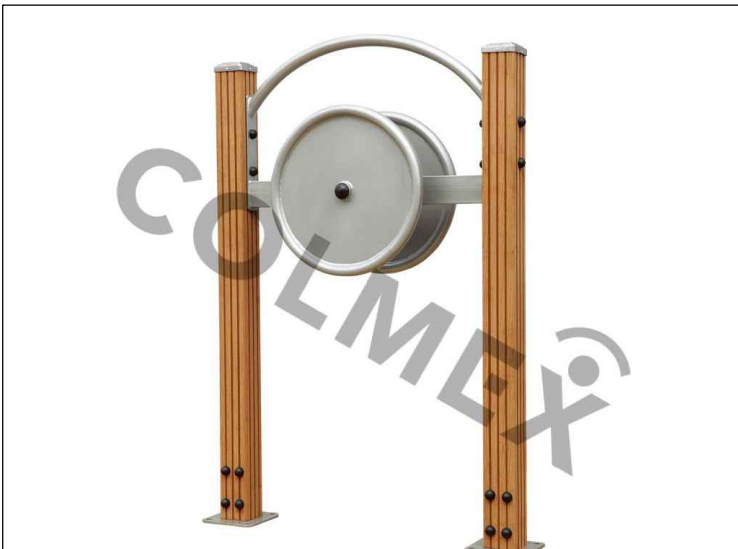
d RUCE 1125x380x1825